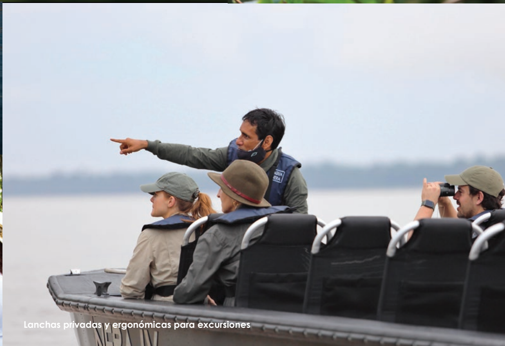
Lanchas privadas y ergonómicas para excursiones