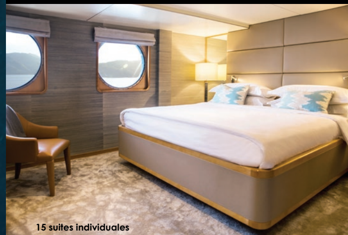
15 suites individuales