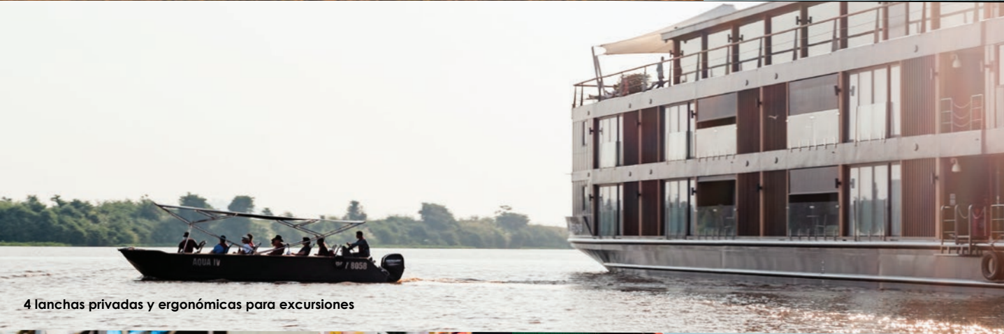
4 lanchas privadas y ergonómicas para excursiones