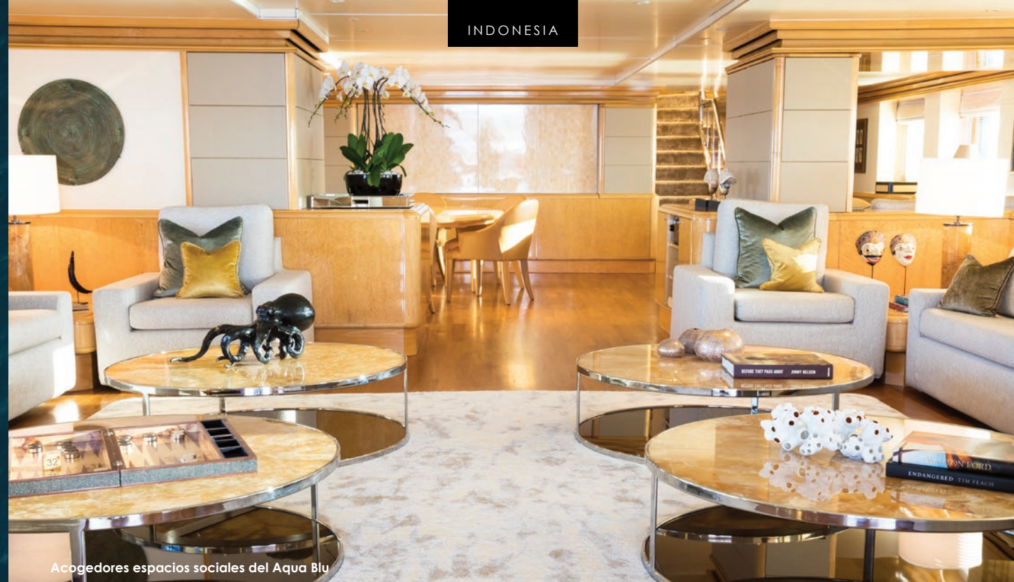
Acogedores espacios sociales del Aqua Blu