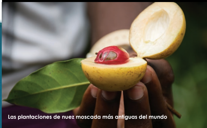
Las plantaciones de nuez moscada más antiguas del mundo