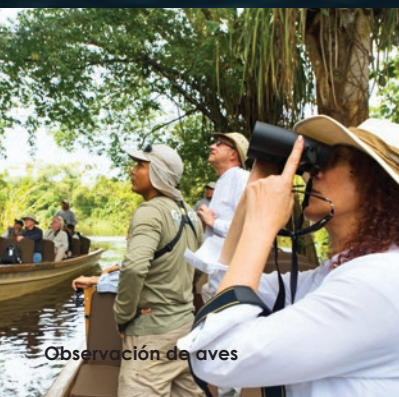
Observación de aves