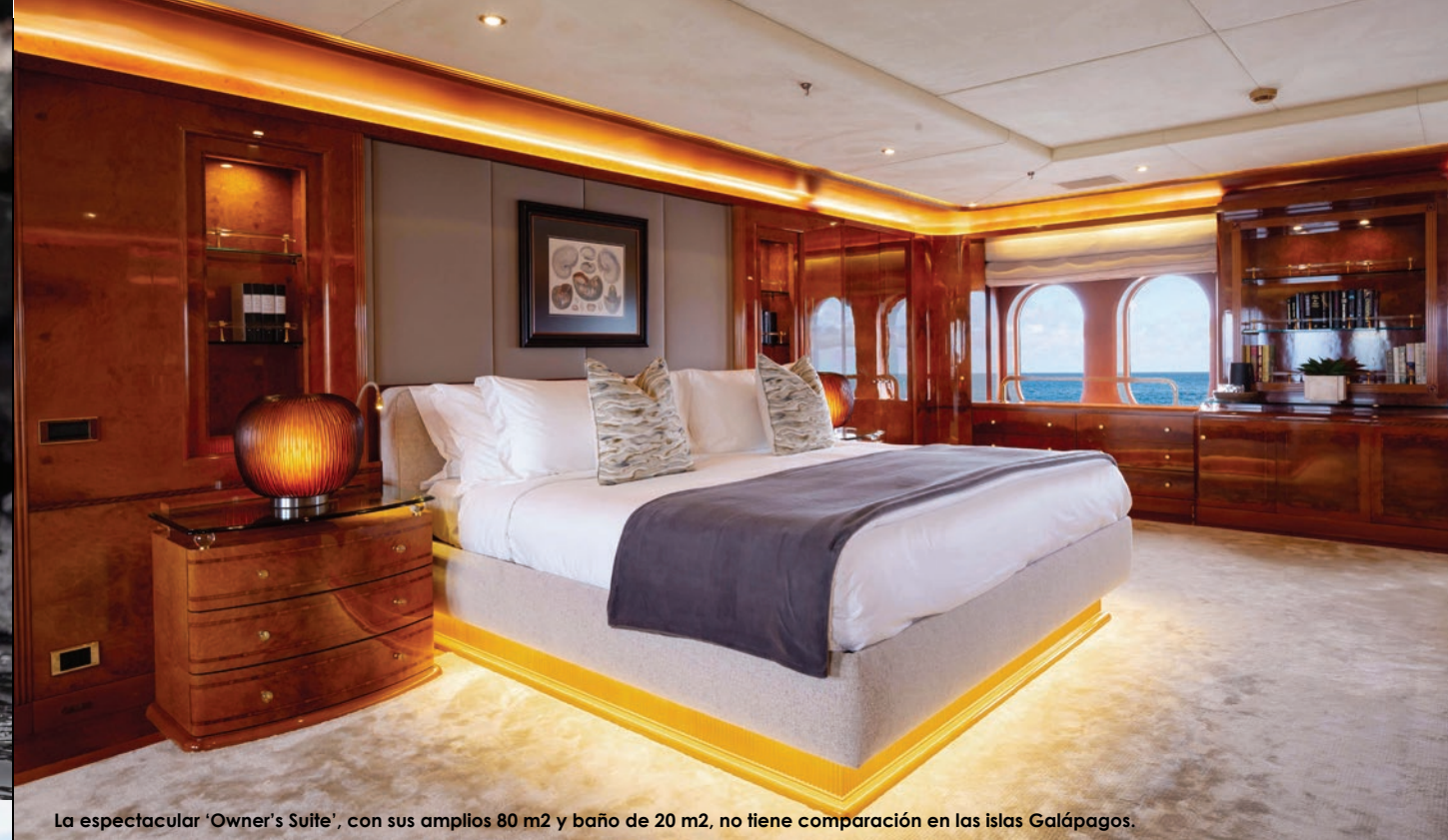
La espectacular 'Owner's Suite', con sus amplios 80 m2 y baño de 20 m2, no tiene comparación en las islas Galápagos.