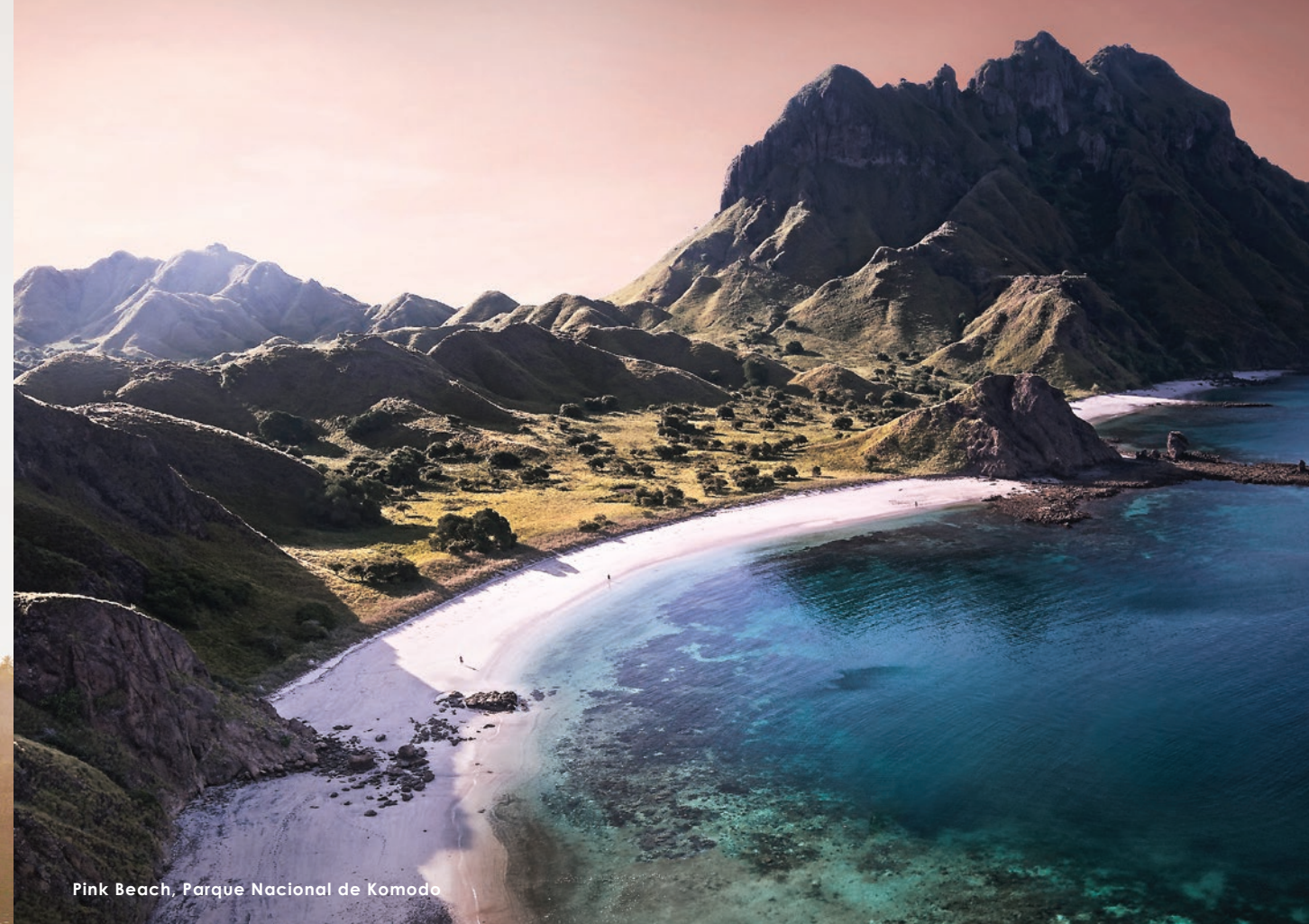
Pink Beach, Parque Nacional de Komodo