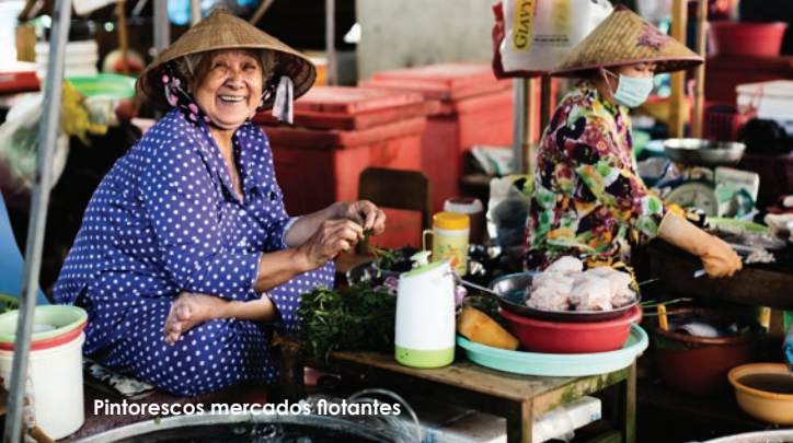
Pintorescos mercados flotantes