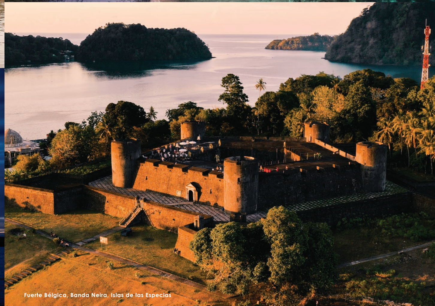
Fuerte Bélgica, Banda Neira, Islas de las Especias