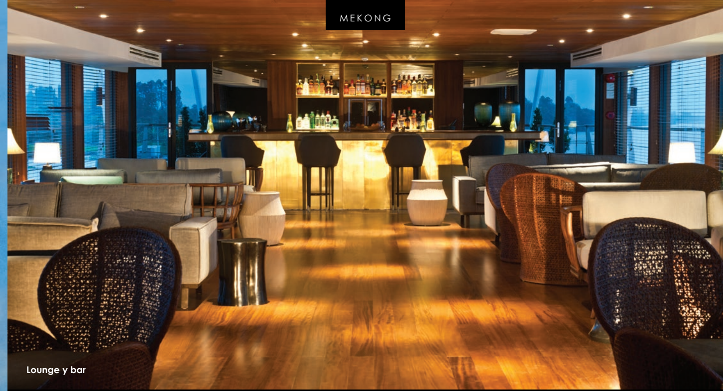
Lounge y bar