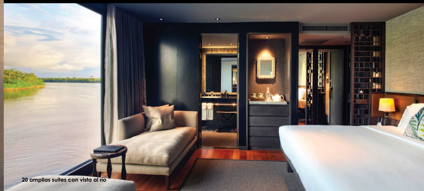
20 amplias suites con vista al río