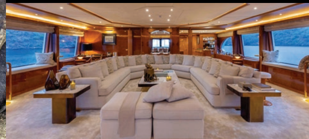
Comparta historias de sus excursiones llenas de aventuras mientras se relaja en el salón principal.