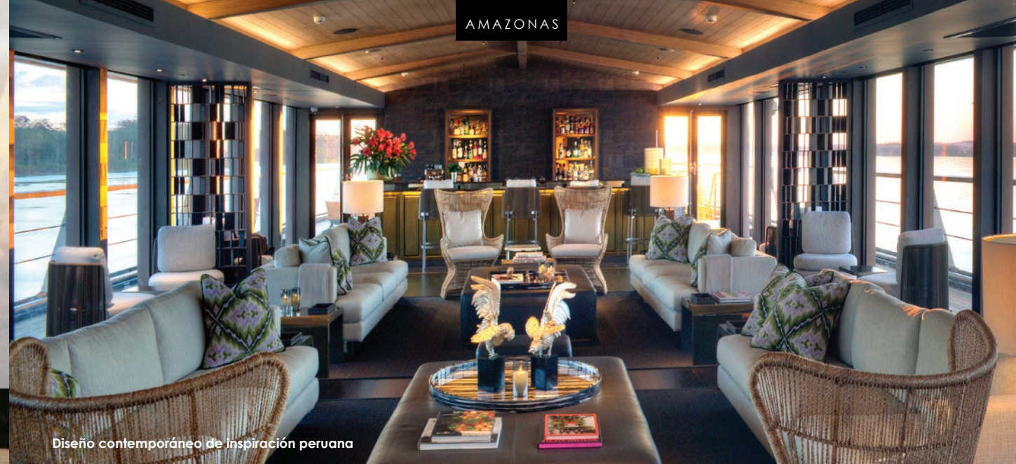
Diseño contemporáneo de inspiración peruana