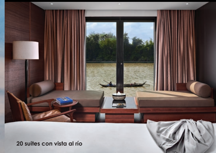
20 suites con vista al río