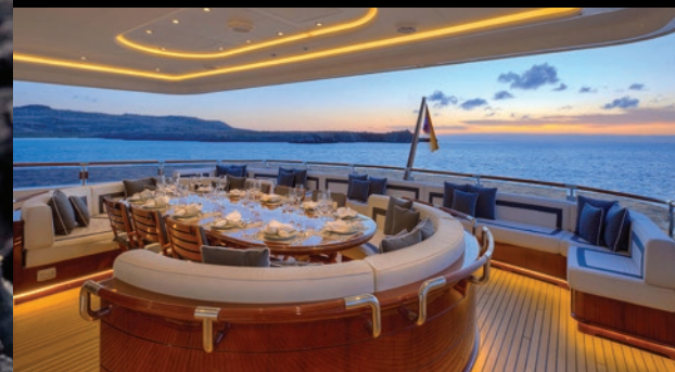
Disfrute de la inspiradora cocina de Aqua Mare servida al aire libre, perfecta para apreciar los fantásticos paisajes del archipiélago.