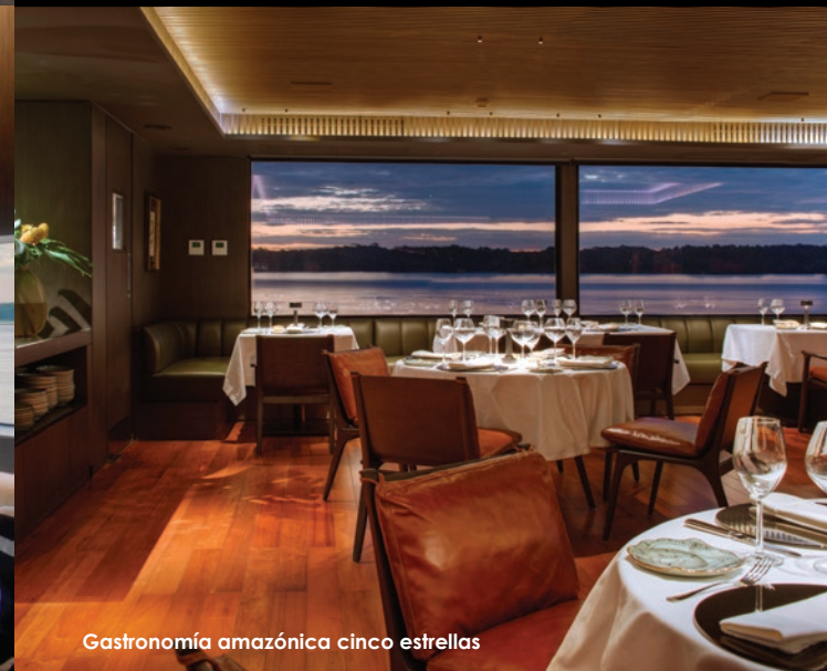
Gastronomía amazónica cinco estrellas