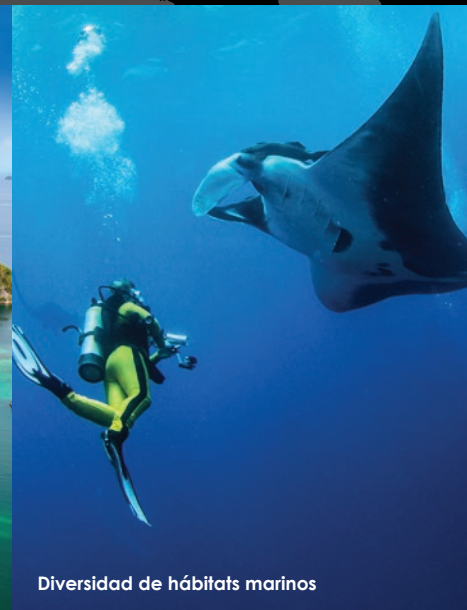
Diversidad de hábitats marinos