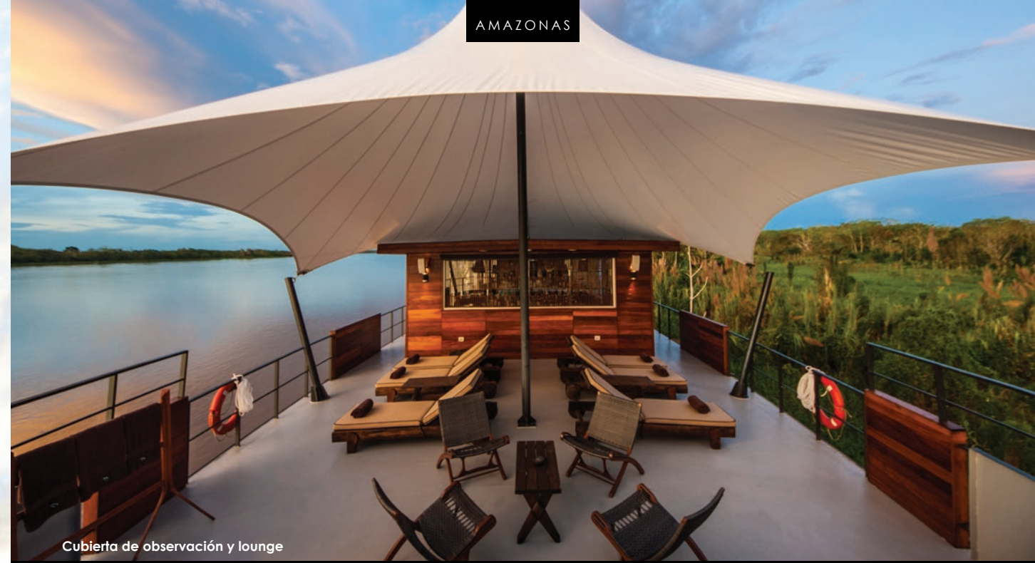
Cubierta de observación y lounge