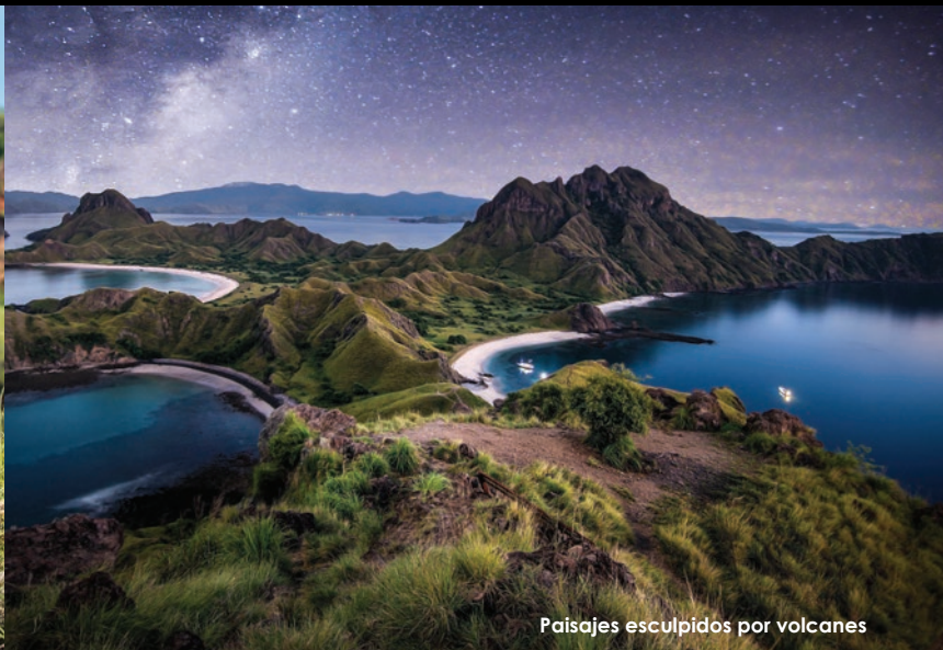
Paisajes esculpidos por volcanes