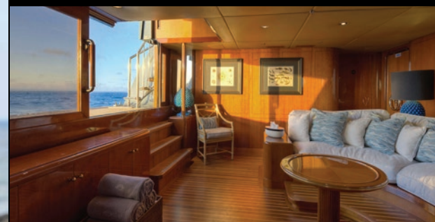
Relájese en el 'Beach Club' con la maravillosa vista panorámica.