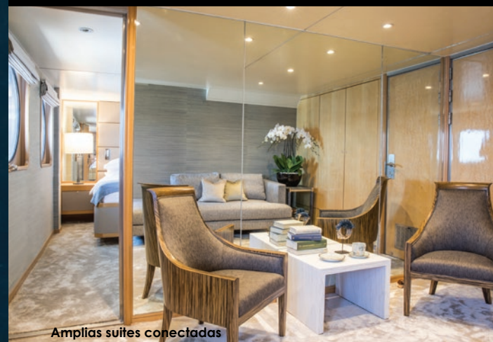
Amplias suites conectadas