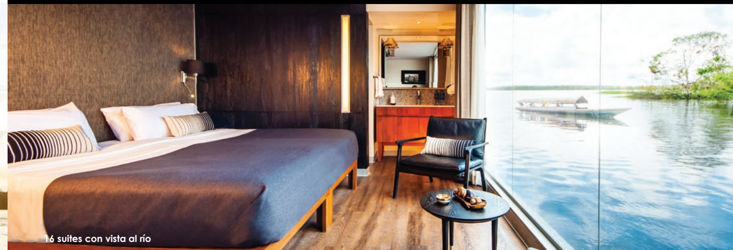
16 suites con vista al río