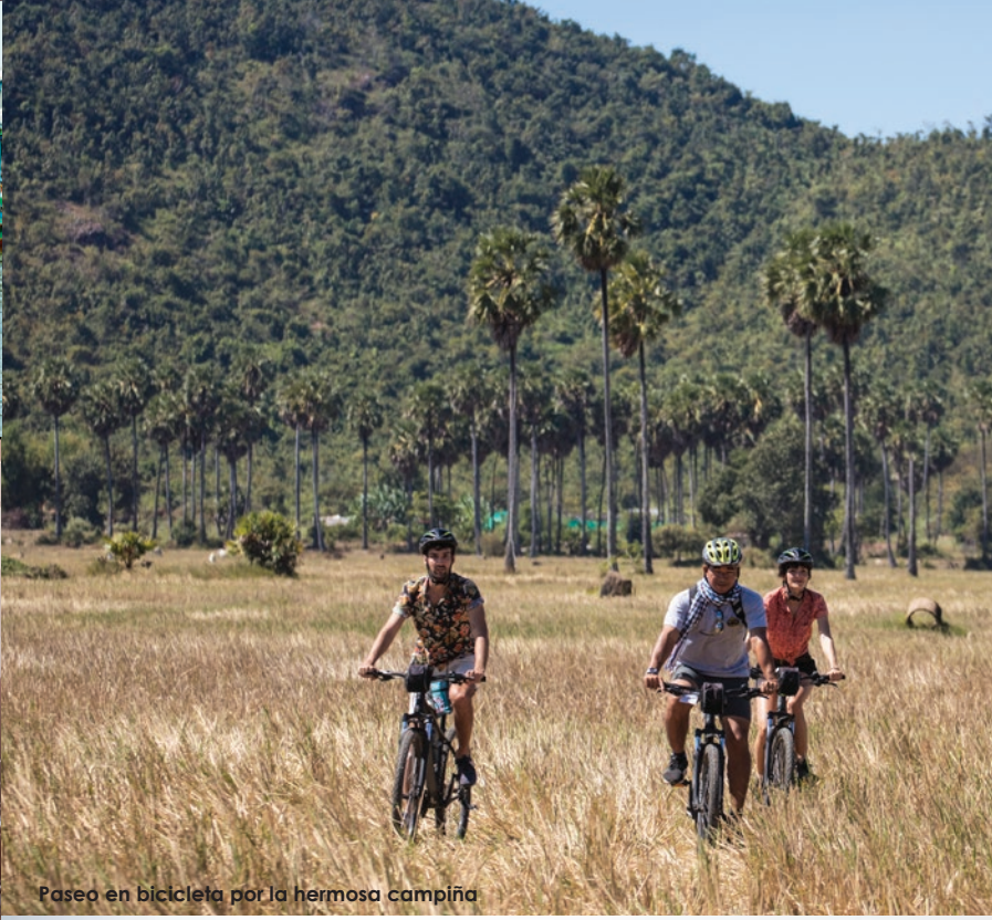
Paseo en bicicleta por la hermosa campiña