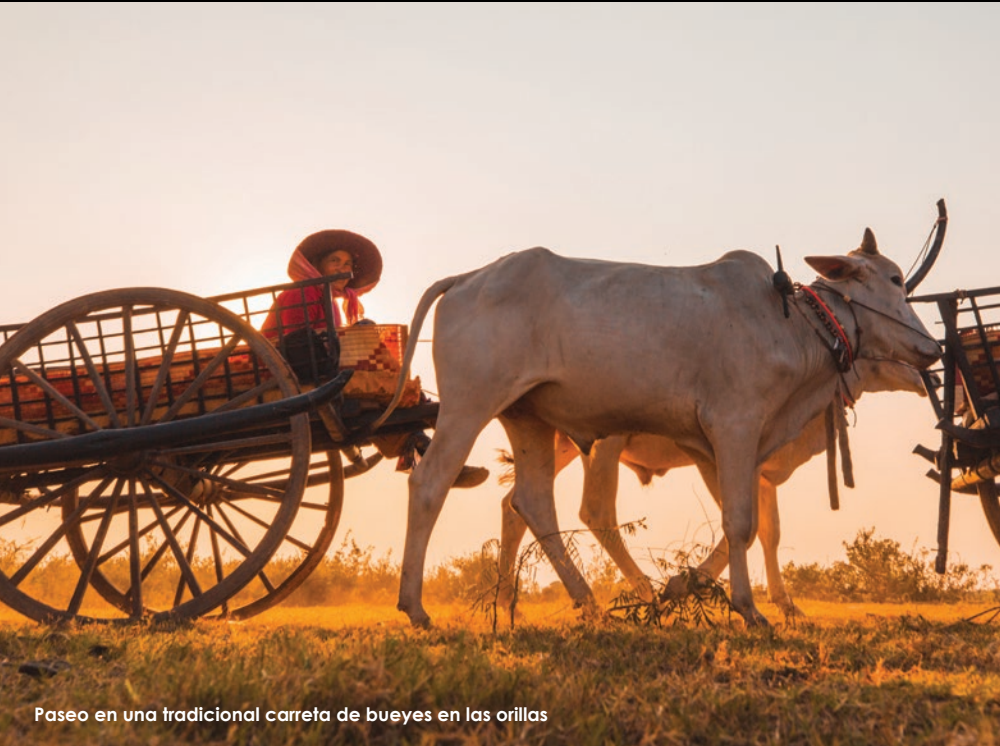
Paseo en una tradicional carreta de bueyes en las orillas