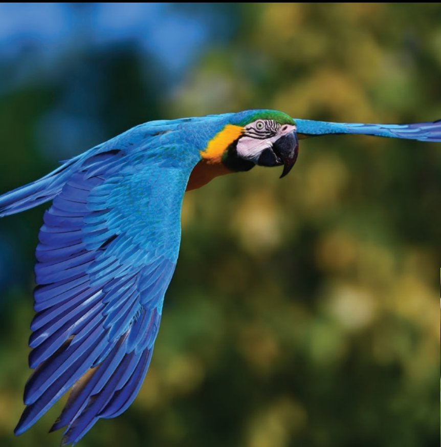
Más de 1,000 especies de animales y 449 aves