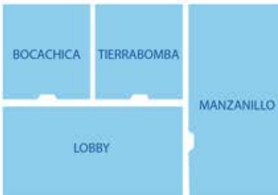
Salones Bocachica, Tierrabomba, Manzanillo