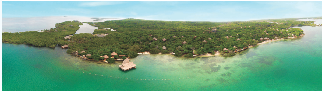
Vista panorámica Hotel Las Islas

Su construcción, galardonada a nivel mundial por el mejor diseño y arquitectura, conecta al huésped con una atmósfera de naturaleza, la cual se respira en cada rincón de este complejo, que cumple con los estándares de hospitalidad y calidad que caracterizan a los establecimientos afiliados a "The Leading Hotels of the World".