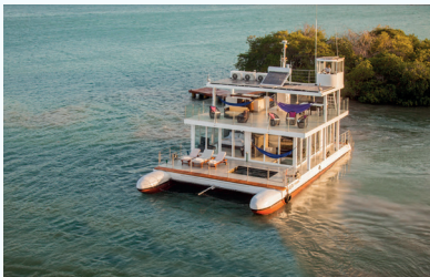
Casa Navegante en Cholón