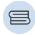
Lavandería y Tintorería (c/cargo)