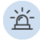
Emergencias médicas 24hs