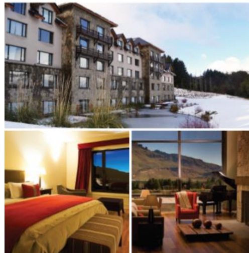
LOI SUITES CHAPELCO