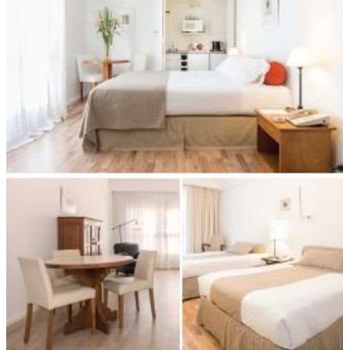
LOI SUITES ESMERALDA