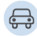
Estacionamiento (con cargo)