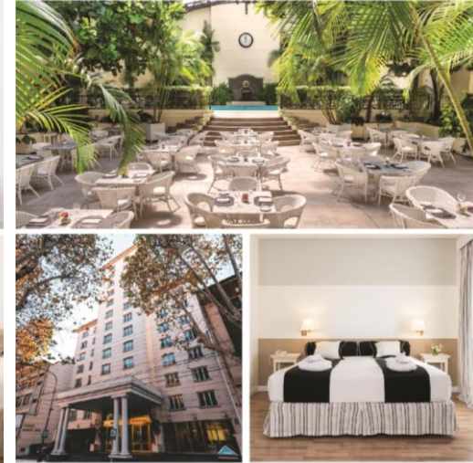
LOI SUITES RECOLETA