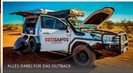
ALLES DABEI FÜR DAS OUTBACK