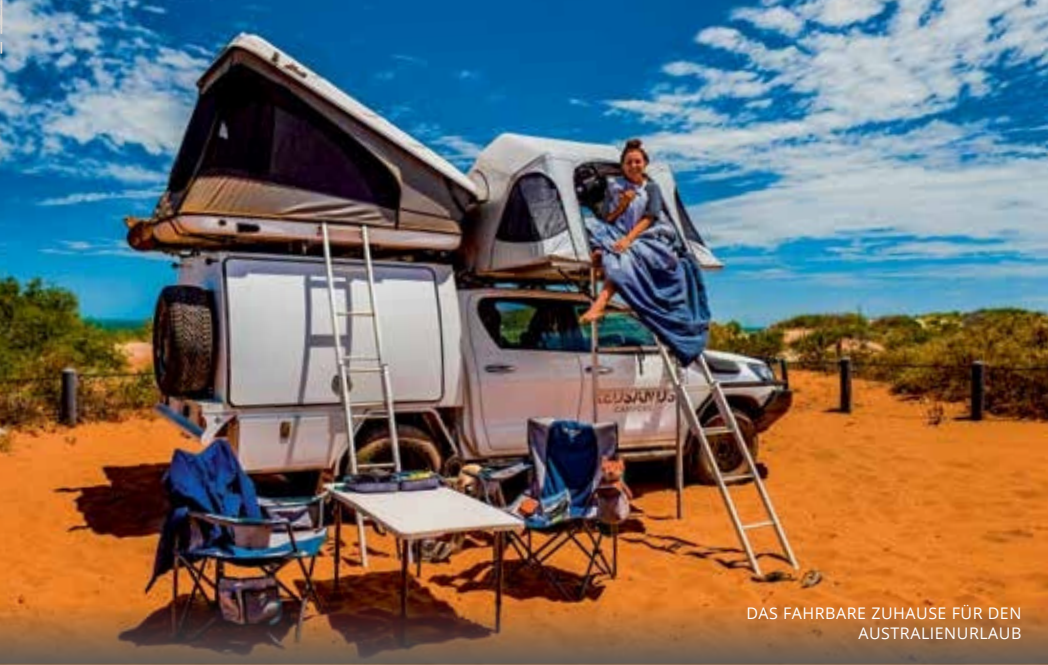
DAS FAHRBARE ZUHAUSE FÜR DEN AUSTRALIENURLAUB