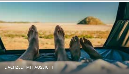
DACHZELT MIT AUSSICHT