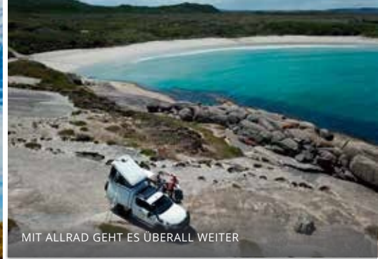
MIT ALLRAD GEHT ES ÜBERALL WEITER